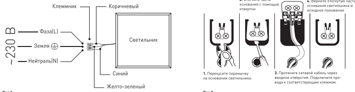
Рис.1. Схема подключения светильника SPO-6-36...-А (с клеммником для БАП).

3.3.2. Этот провод необходимо подключить к проводу источника питания с помощью внешнего клеммника (в комплект не входит) в соответствии со схемой, изображенной на рис. 1; модель SPO-6-36 не имеет вывода проводов, подключение происходит через клеммную колодку в соответствии со схемой на рис. 2.